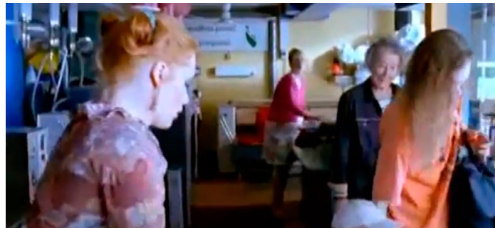
Фрагмент 2. http://youtu.be/Vm4tYkKeKik

циальный алгоритм, выстраивавший эмоциональную логику наррации в зависимости от регистрируемой датчиками эмоциональной реакции зрителей и усиливавший тем самым эмоциональную реакцию. Биосенсорные датчики продемонстрировали возможность «схватывания» эмоциональной динамики монтажной композиции фильма. Оказалось, что зритель воспринимает не только ритм, цвет, графику и т. п., но и эмоции. Более того, проект продемонстрировал возможность активного участия со стороны зрителя. В этом активном участии формируется его эмоциональный опыт событий и характеров, который и представляет собой «исследование» — inquiry . Enactive cinema в итоге предстает как сложная система взаимодействия автора и зрителя. Данное кино является инструментальным в том смысле, которое вкладывал в него Дьюи, т. е. вызывающим постоянно обновляемую реакцию со стороны реципиента.